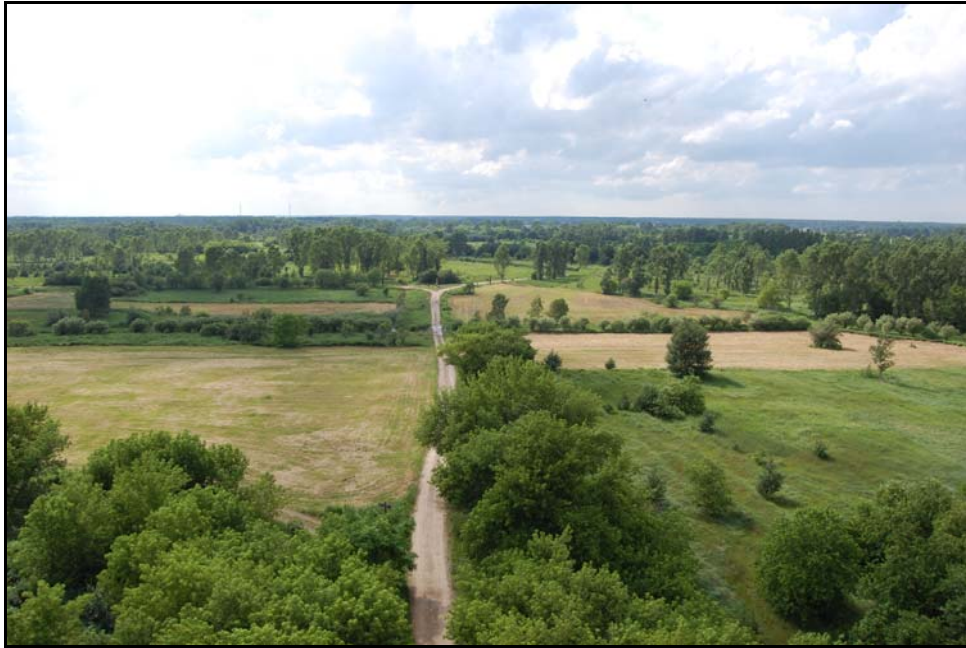
Abb1: Rieselfeldlandschaft bei Hobrechtsfelde

Auch mehr als 10 Jahre später sind die positiven Effekte auf den Bucher Rieselfeldern nachweisbar. Neutrale pH-Werte und Tonminerale verhindern eine Remobilisierung von Schadstoffen. Die anfänglich unbelebten Substrate haben sich zu guten Pflanzstandorten mit einem guten Bodenleben entwickelt. Auf die überlehnten Standorte sind Bodentiere (insbesondere Lumbriciden) eingewandert, welche vorher an den sauren pH-Verhältnissen gescheitert sind.