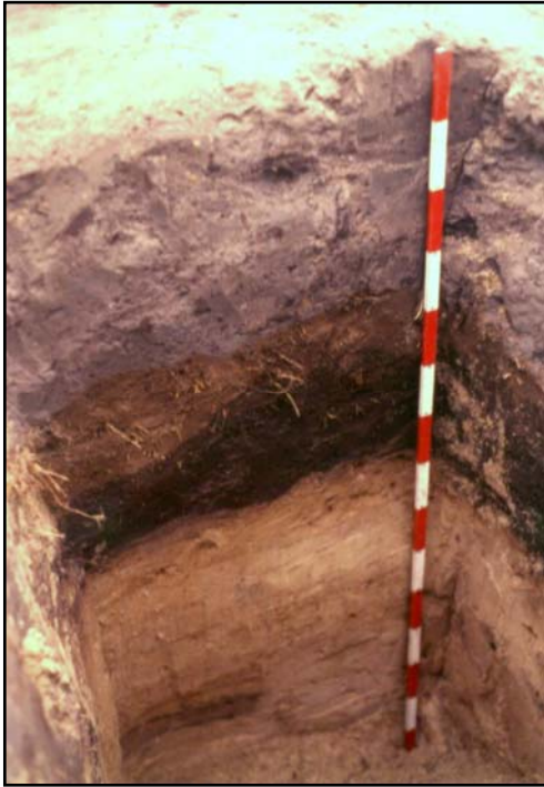
Abb 2: Typisches Rieselfeldprofil mit Überlehmung

2002 wurde der von den Berliner Forsten schon 1992 postulierte Planungsgedanke, die ehemaligen Bucher Rieselfeldflächen zu einer waldgeprägten Erholungslandschaft zu entwickeln in die Tat umgesetzt. Viele der von KOPPE (2002) entwickelten Ideen fanden Eingang in diese Umsetzungsplanung.